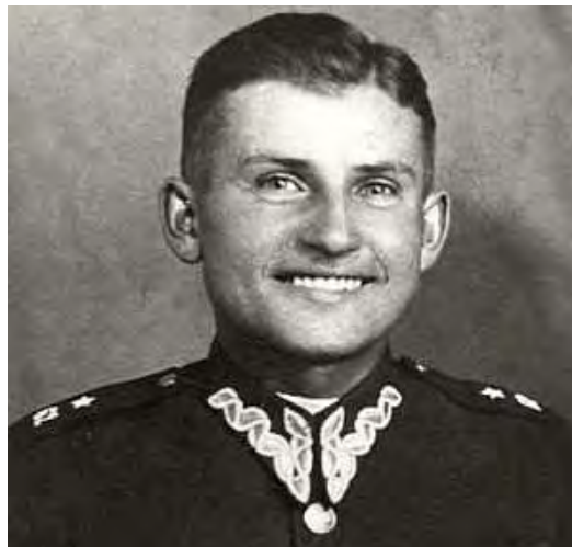
Płk Łukasz Ciepliński ps. "Pług"

Gdy śmierć męczeńska dotknie mego czoła. 2