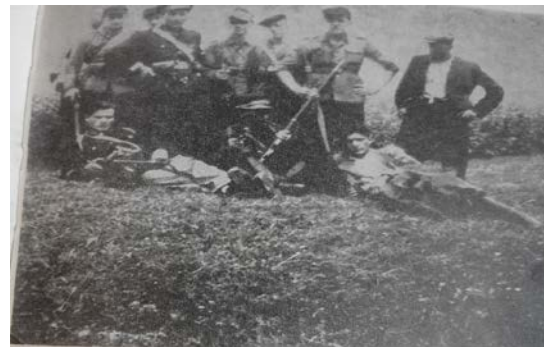
ŁĄCZNIK OKRĘGOWYCH WŁADZ RUCHU LUDOWEGO (PSEUDONIM „WILK”). 1943 – WYSŁANY DO WARSZAWY NA KURS INSTRUKTORÓW DYWERSJI I SABOTAŻU. DOWÓDCA ODDZIAŁU PARTYZANCKIEGO BCH – LSB (PSEUDONIM „SĘP”), RANNY PODCZAS AKCJI W BOBOWEJ.

Komendant „Sęp” (w mundurze polskiego policjanta) w otoczeniu swoich żołnierzy. Stoja od lewej: „Serama”, „Biały”, „Prawda”, „Grzybek”, „Ryś”, „Zajac”, „Miot”. Leżą: „Zbik”, „Johan”, „Kozek”.