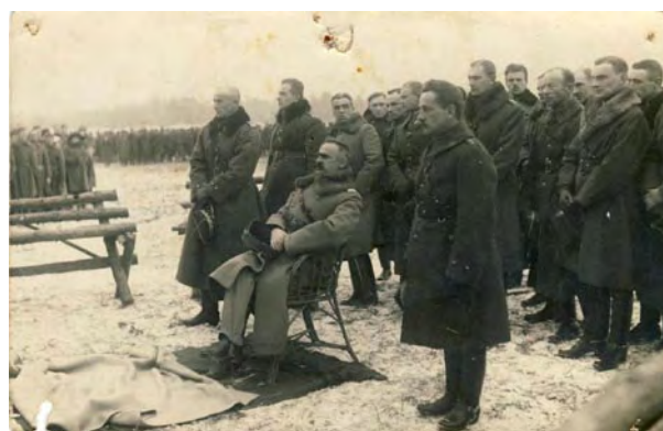
Marszałek Józef Piłsudski podczas Mszy polowej w Lidzie, w której uczestniczył pradziadek